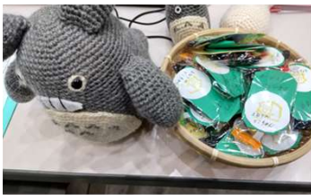
▲トトロとでこちゃんアメでお出迎え