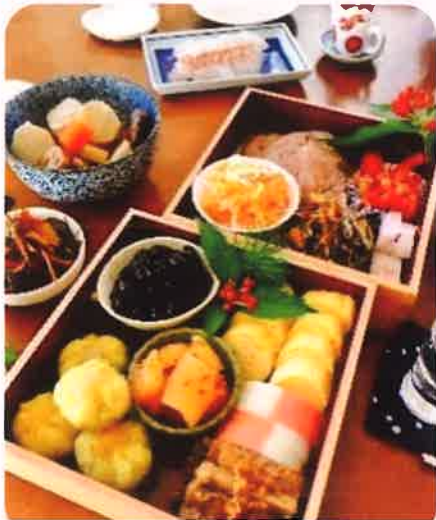
なじみの郷土料理やおふくろの味