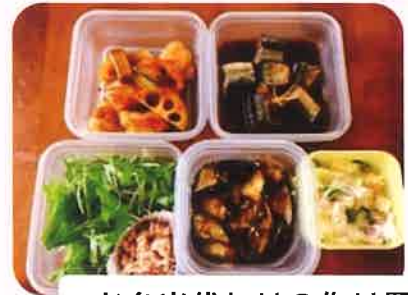
お弁当代わりの作り置き