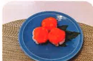
えんげ手まり寿司